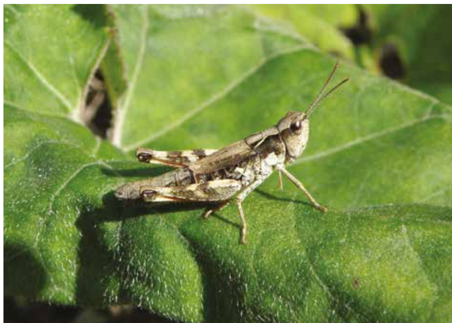
Fig. 4 - Chorthippus (Glyptobothrus) pullus , ♀, Sappada (UD).

- Chorthippus (Glyptobothrus) pullus , ♀, Sappada (UD).