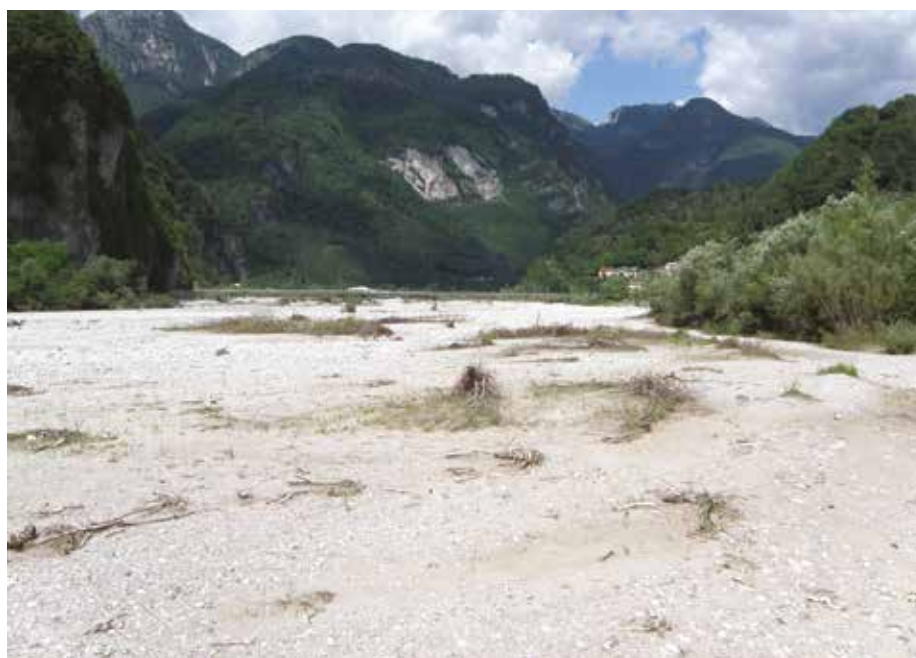
Fig. 9 - Greto del F. Piave presso Davestra (Ospitale di Cadore, BL), 465 m. Habitat di Sphingonotus caerulans caerulans , Oedipoda caerulescens caerulescens , Chorthippus (Glyptobothrus) pullus . - The gravel-bed of Piave River near Davestra (Ospitale di Cadore, BL), 465 m. Habitat of Sphingonotus caerulans caerulans , Oedipoda caerulescens caerulescens , Chorthippus (Glyptobothrus) pullus .

Esemplari di C. pullus erano stati raccolti da Ramme nel 1912 presso San Vigilio di Marebbe (RAMME 1921), in una valle laterale della Val Badia. HILPOLD et al. (2017) riportano che la specie è stata cercata ma non più trovata nella Gadertal (Val Badia).