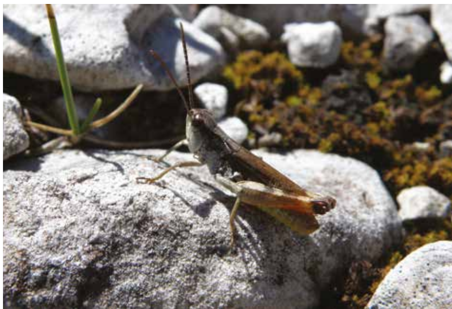
Fig. 3 - Chorthippus (Glyptobothrus) pullus , ♂, Lago del Predil (Tarvisio, UD). - Chorthippus (Glyptobothrus) pullus , ♂, Predil Lake (Tarvisio, UD).

Alta Val Cellina, Pian de Cea (Claut, PN), 915 m, terrazzi fluviali, 31.VII.2013, 1♀, leg. e coll. F. Tami;