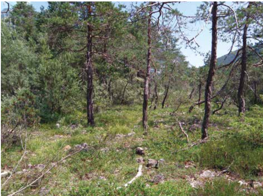
Fig. 6 - Terrazzo fluviale colonizzata da Pinus sylvestris sul F. Tagliamento presso Forni di Sotto (UD), 690 m. Habitat di Pholidoptera griseoaptera , Podisma p. pedestris , Psophus stridulus , Euthystira brachyptera , Pseudochorthippus parallelus parallelus , Chorthippus (Glyptobothrus) pullus .

Per la Val Canale si dispone di un dato storico, risalente al 1908, relativo al F. Fella presso Bagni di Lusnizza (PUSCHNIG 1910). Scendendo lungo la Val Canale prima e il Canale del Ferro poi, a valle di Malborghetto il F. Fella presenta ancora oggi alcuni tratti di greto con terrazzi fluviali che sono potenzialmente idonei alla