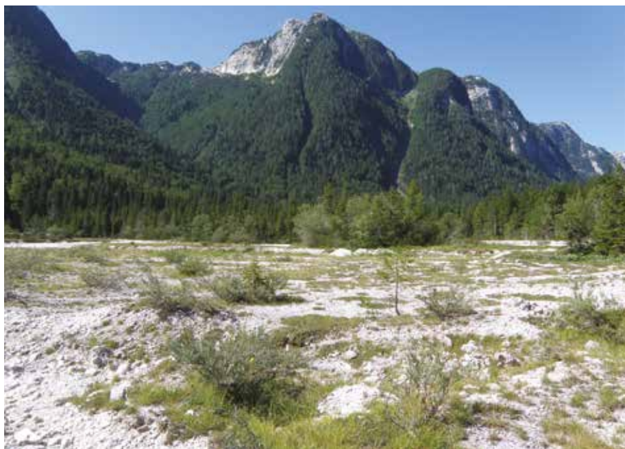
Fig. 5 - Conoide di deiezione a monte del Lago del Predil (Tarvisio, UD), 985 m. Habitat di Podisma pedestris pedestris , Psophus stridulus , Stenobothrus rubicundulus , Euthystira brachyptera , Chorthippus (Glyptobothrus) biguttulus biguttulus , Chorthippus (Glyptobothrus) pullus .

Nella parte italiana del bacino del F. Isonzo, finora C. pullus è stato rinvenuto solo nell'Alta Val Torre, nel greto e sui terrazzi fluviali del T. Mea, affluente del T. Torre (TAMI 2012); le osservazioni più recenti risalgono al 2015. Questa popolazione appare isolata ma occupa un'area abbastanza vasta, potenzialmente di circa 2 km