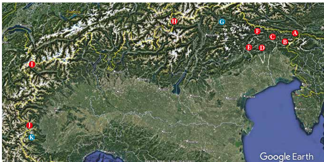
Fig. 1 - Distribuzione di Chorthippus (Glyptobothrus) pullus in Italia. In rosso le aree/località con dati dal 1990, in blu quelle con dati prima del 1990. Per i dettagli delle aree A-F si veda la Fig. 2. A - Bacino del T. Slizza (Fig. 2: stazioni 1-4). B - Alta Val Torre (Fig. 2: stazione 5). C - Bacino del F. Tagliamento (Fig. 2: stazioni 6-20). D - Alto bacino del F. Meduna (Fig. 2: stazione 21). E - Bacino del T. Cellina (Fig. 2: stazioni 22-26). F - Bacino del F. Piave (Fig. 2: stazioni 27-31). G - San Vigilio di Marebbe, BZ (RAMME 1921). H - Valle Lunga, Malga di Melago, BZ (TAMI et al. 2005; WILHALM et al. 2019). I - Val Ferret, AO (MARCHESI et al. 1998). J - Val di Susa, TO: Alta Valle del T. Ripa; F. Dora Riparia, Oulx (SINDACO et al. 2012). K - Val Pellice, Conca del Prà, TO (BACCETTI 1958).

Nel periodo fra il 2002 e il 2004 abbiamo rinvenuto alcune popolazioni di C. pullus a Sappada e nel Tarvisiano e abbiamo deciso di indagarne in modo più approfondito la distribuzione nelle Alpi orientali italiane. Negli anni successivi abbiamo organizzato numerose escursioni finalizzate ad individuare popolazioni di