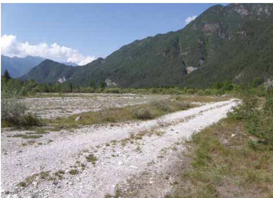
Fig. 7 - Lembi di prati magri su terrazzo fluviale lungo il T. Tarceno (Tramonti di Sotto, PN), 330 m. Habitat di Calliptamus italicus italicus , Oedipoda caerulescens caerulescens , Stenobothrus rubicundulus , Chorthippus (Glyptobothrus) pullus .

- River terrace colonized by Pinus sylvestris along Tagliamento river near Forni di Sotto (UD), 690 m. Habitat of Pholidoptera griseoaptera , Podisma p. pedestris , Psophus stridulus , Euthystira brachyptera , Pseudochorthippus parallelus parallelus , Chorthippus (Glyptobothrus) pullus .