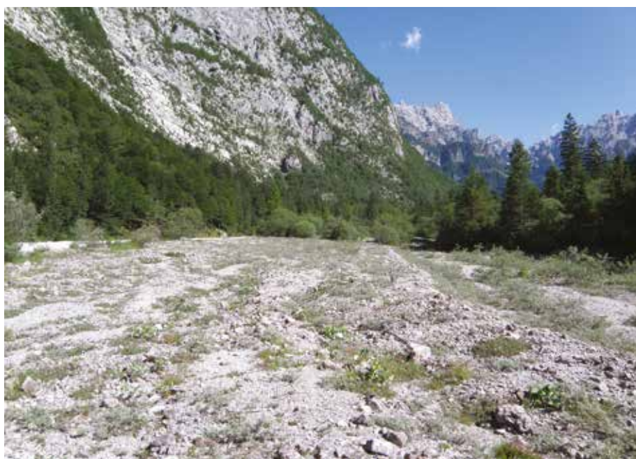
Fig. 8 - Terrazzi fluviali in alta Val Cellina a Pian de Cea (Claut, PN), 915 m. Habitat di Kisella irena (FRUHSTORFER, 1921), Psophus stridulus , Euthystira brachyptera , Pseudochorthippus parallelus parallelus , Chorthippus (Glyptobothrus) biguttulus biguttulus , Chorthippus (Glyptobothrus) pullus .

Più a valle finora l'abbiamo rinvenuto solo lungo il T. Cellina presso Contron. Tuttavia riteniamo che habitat adatti alla specie siano presenti lungo il T. Cimoliana in tutto il tratto compreso fra Cimolais e la confluenza con il T. Cellina e con discontinuità anche più a valle lungo il T. Cellina e nelle vallate laterali (Val Prescudin, Val Pentina) fino al Lago di Barcis.